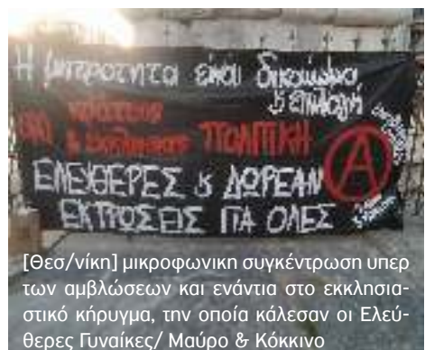
[Θεσ/νίκη] μικροφωνική συγκέντρωση υπέρ των αμβλώσεων και ενάντια στο εκκλησιαστικό κήρυγμα, την οποία κάλεσαν οι Ελεύθερες Γυναίκες/ Μαύρο & Κόκκινο