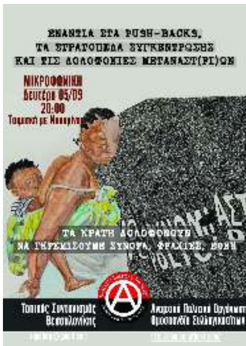
Ποστέρ για την ημερίδα της 5ης Σεπτεμβρίου

Παράλληλα, στο εσωτερικό της χώρας επιχειρείται η διαρκής και με σκληρότερους όρους απομόνωση των προσφύγων και μεταναστών από τον κοινωνικό ιστό και ο εγκλεισμός τους σε δομές και στρατόπεδα συγκέντρωσης, όπου χιλιά-