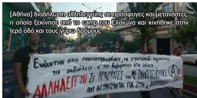
[Αθήνα] διαδήλωση αλληλεγγύης σε πρόσφυγες και μετανάστες, η οποία ξεκίνησε από το camp του Ελαιώνα και κινήθηκε στην Ιερά οδό και τους γύρω δρόμους

Συνέλευση Αναρχικών για την Κοινωνική και Ταξική Χειραφέτηση