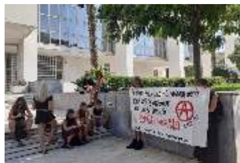
[Αθήνα] Από τη συγκέντρωση που πραγματοποιήθηκε έξω από τον Άρειο Πάγο για την αμφισβήτηση του βουλεύματος από τη Γεωργία, το οποίο απαλλάσσει τον ένα εκ των βιαστών της

Το δικαίωμα στην έκτρωση αμφισβητείται εν μέσω μίας καθολικής προσπάθειας αναδιάρθρωσης του κρατικο-καπιταλιστικού συστήματος που αγκομακά να διατηρήσει την εξουσία του προωθώντας τη συντηρητικοποίηση και την πειθάρχηση σε όλα τα επίπεδα της κοινωνικής ζωής με στόχο την επιστροφή στις βασικές αρχές του συστήματος: στην πυρηνική οικογένεια και την εθνική ομοιογένεια. Η πυρηνική οικογένεια ως δομή που υιοθετήθηκε από το σύστημα αυτό, στον αντίποδα και μέσα από τη διάλυση της συλλογικής και κοινοτικής ζωής, αποτελεί χρήσιμο εργαλείο του, καθώς για την ίδια την ύπαρξη αλλά και τη διαιώνισή του επιζητά διαρκώς καινούρια εργατικά χέρια και παράλληλα τροφοδοτείται από τη συρρίκνωση των κοινωνικών δεσμών αλληλεγγύης. Η έκτρωση είναι εχθρός του καπιταλισμού και του милитарισμού. Η αφήγηση περί «ηθικότητας» των εκτρώσεων αλλά και η ίδια η πρόσβαση αφορούν κυρίως τις γυναίκες των πληβιακών στρωμάτων, για τις οποίες πίσω από την εξύμνηση του ρόλου των γυναικών ως μητέρες, κρύβεται η επιστροφή τους στη σφαίρα του ιδιωτικού και η μετατροπή τους σε αναπαραγωγικές μηχανές, με πρωτεύοντα σκοπό τη γέννηση εργατών και στρατιωτών για την εξυπηρέτηση των αναγκών του κρατικό - καπιταλιστικού συστήματος. Η εκκλησία μόνο ως αρωγός θα μπορούσε να λειτουργήσει στην προσπάθεια αυτή και ο μεσαιωνικός σκοταδισμός της απλώνεται ξανά σαν απειλή και κατάρα πάνω από τις γυναίκες και την κοινωνία που αγωνίζεται για ελευθερία.