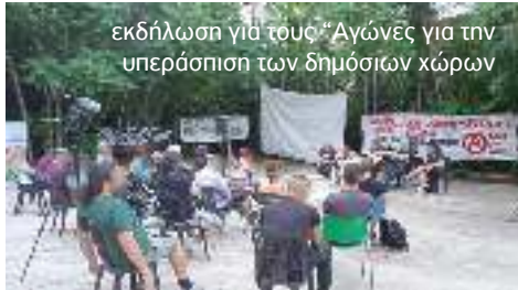
εκδήλωση για τους "Αγώνες για την υπεράσπιση των δημόσιων χώρων"