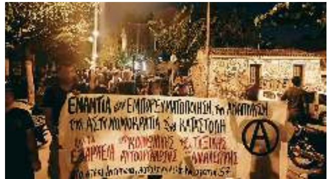
Φωτογραφία από το πανό της κατάληψης Λ.Κ. 37 και του στεκιού Αντίπνοια στην πορεία υπεράσπισης των Εξαρχείων στις 9 Σεπτεμβρίου

Όλα τα παραπάνω λοιπόν αποτελούν εκφάνσεις της καπιταλιστικής ολοκλήρωσης στο σήμερα, προσπάθειες νεοφιλελευθεροποίησης και επέκτασης της βαρβαρότητας σε κάθε πτυχία της κοινωνικής πραγματικότητας. Πάγια τακτική του κρατικού μηχανισμού εξάλλου η χρησιμοποίηση των ημερών του Αυγούστου για την υλοποίηση