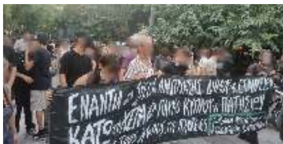
Από την πορεία πραγματοποιήθηκε από το δημαρχείο μέχρι τους δρόμους και την πλατεία Εξαρχείων για την υπεράσπιση όλων των δημόσιων πράσινων χώρων απέναντι στην επιχειρούμενη ανάπλαση και εμπορευματοποίησή τους

Απέναντι στα σχέδια ανάπλασης των δημοτικών αρχών και των ιδιωτικών συμφερόντων που προσχηματικά επικαλούνται στην αναβίωση και την εξυγίανση του πάρκου, το Πάρκο Κύπρου και Πατησίων είναι ήδη εδώ. Δημιουργήθηκε από το μηδέν από κατοίκους και αλληλέγγυους έπειτα από την καταστροφή του από το Δήμο Αθηναίων στις 26 Γενάρη του 2009, με σκοπό την μετατροπή του σε πάρκινγκ. Τα χαράματα της ημέρας εκείνης, με εντολή της δημοτικής αρχής και του τότε δημάρχου Νικήτα Κακλαμάνη, μηχανήματα και συνεργεία του Δήμου, συνοδευόμενα από μπάτσους, εισέβαλλαν στο πάρκο, ξερίζωσαν τα 55 δέντρα του, κατέστρεψαν την παιδική χαρά, τα παγκάκια και το δίκτυο υδροδότησής του. Είναι εδώ χάρη στους κατοίκους της περιοχής και αλληλέγγυους που το υπερασπίστηκαν ενάντια στην καταστροφή του, το ξαναδημιούργησαν φυτεύοντας δεκάδες νέα δέντρα, ανακατασκευάζοντας την παιδική χαρά και τοποθετώντας παγκάκια. Είναι εδώ χάρη στα 13 χρόνια αδιάλειπτου αυτοοργανωμένου αγώνα