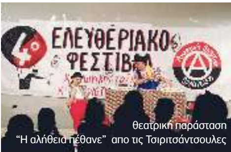
θεατρική παράσταση "Η αλήθεια πέθανε" από τις Τσιριτσάντσουλες

Το τρίημερο 8, 9 και 10 Ιουλίου 2022 πραγματοποιήθηκε στην Αθήνα, στον χώρο της Α' ΦΕΠΑ (Παν/πολη Ζωγράφου) το 4ο Ελευθεριακό Φεστιβάλ Κοινωνικής, Ταξικής & Διεθνιστικής Αλληλεγγύης της ΑΠΟ-ΟΣ. Κατά τη διάρκεια του φεστιβάλ έλαβε χώρα πλήθος πολιτικών και πολιτιστικών εκδηλώσεων, όπως επίσης στο χώρο του φεστιβάλ υπήρχε μια πληθώρα από έντυπο πολιτικό υλικό, βιβλία κινηματικών εκδόσεων, αφίσες αλλά και έκθεση φωτογραφίας και σκίτσων. Η πραγματοποίηση του φεστιβάλ για ακόμα μια χρονιά μέσα σε μια συνθήκη εντεινόμενης καταστολής, εκμετάλλευσης, καταπίεσης και φτωχοποίησης, σε μια συνθήκη όξυνσης της επίθεσης κράτους και κεφαλαίου σε κάθε κοινωνικό πεδίο και μέτωπο, σε μια συνθήκη στοχοποίησης του αναρχικού κινήματος και των αγωνιστών/τριών του μέσω της συνεχιζόμενης και εν εξελίξει κατασταλτικής εκστρατείας του κράτους, με τον πόλεμο να μαίνεται και εν μέσω πανδημίας, αποτέλεσε για εμάς ευκαιρία για να μπορέσουμε να μοιραστούμε τις σκέψεις μας πάνω σε μια σειρά ζητημάτων, να ανταλλάξουμε προβληματισμούς και απόψεις αλλά και τις εμπειρίες μέσα από αγώνες που έχουν αναπτυχθεί στο κοινωνικό πεδίο. Καθώς και μας επιβεβαίωσε για ακόμα μια φορά την αναγκαιότητα ύπαρξης και τη σημασία ενός αναρχικού φεστιβάλ, ειδικά σε μια περίοδο όπου αναβαθμίζεται η κεντρική κατασταλτική πολιτική του κράτους, το δόγμα της προληπτικής αντιεξέγερσης.