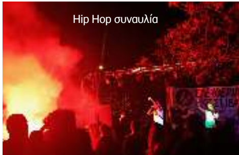
Hip Hop συναυλία