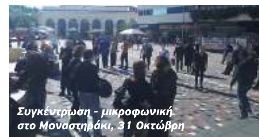
Συγκέντρωση - μικροφωνική στο Μοναστηράκι, 31 Οκτώβρη