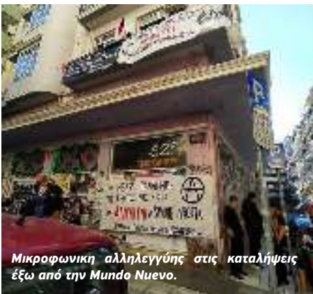
Μικροφωνική αλληλεγγύης στις καταλήψεις έξω από την Mundo Nuevo.