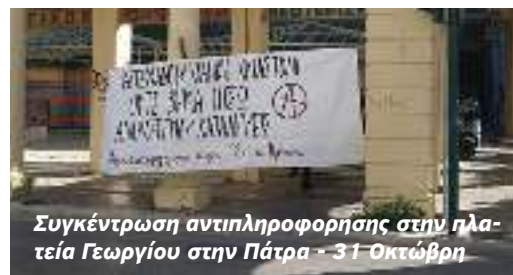
Συγκέντρωση αντιπληροφόρησης στην πλατεία Γεωργίου στην Πάτρα - 31 Οκτώβρη

Αναρχική Πολιτική Οργάνωση | Ομοσπονδία Συλλογικοτήτων