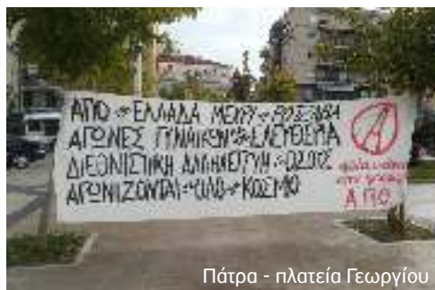
Πάτρα - πλατεία Γεωργίου