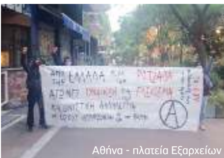
Αθήνα - πλατεία Εξαρχείων

Στο πλαίσιο της βδομάδας αλληλεγγύης στην επανάσταση της Ροζάβα η "Ομάδα ενάντια στην πατρι-αρχία" ΑΠΟ-ΟΣ ανταποκρίνεται στο κάλεσμα για κινήσεις αλληλεγγύης στις γυναίκες που αγωνίζονται