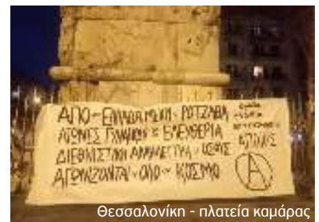
Θεσσαλονίκη - πλατεία καμάρας