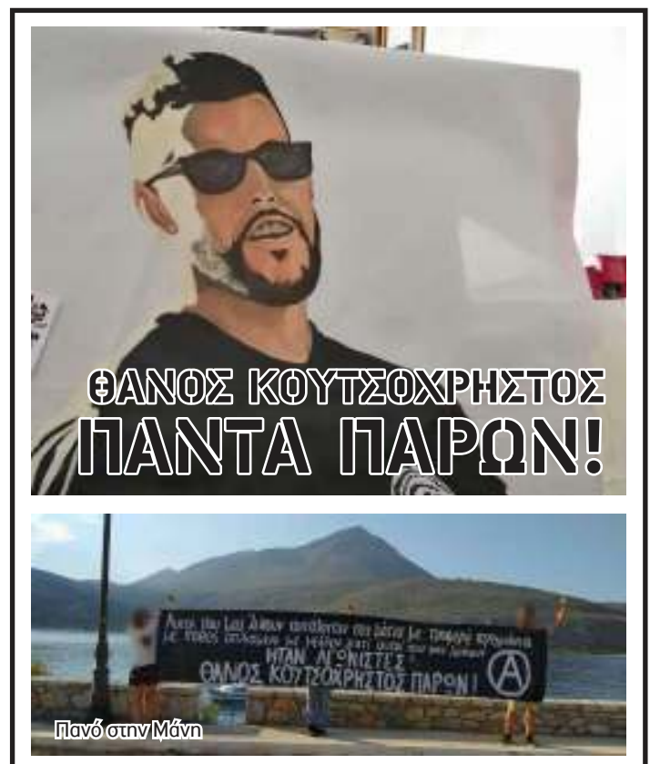
Πανό στην Μάνη

Επαναστατική Αναρχική Δράση (DAF) / Τουρκία Αναρχική Πολιτική Οργάνωση - Ομοσπονδία Συλλογικοτήτων (ΑΠΟ) / Ελλάδα