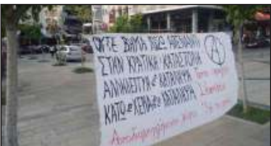
Πανό αλληλεγγύης στις καταλήψεις από τον Αυτοδιαχειριζόμενο χώρο "Επι τα Πρόσω" στην Πάτρα