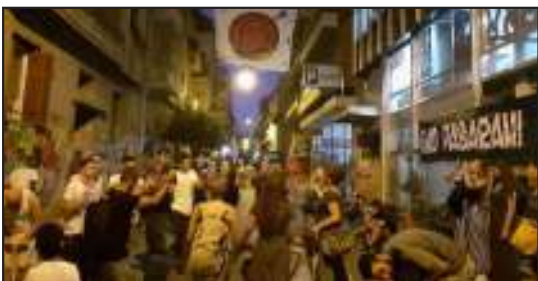
Φωτογραφίες από τις συγκεντρώσεις στην κατάληψη Λέλας Καραγιάννη και στη Νοταρά 26