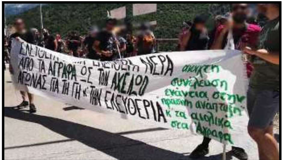
Από τη διαδήλωση στο φράγμα της Μεσοχώρας ενάντια στην λειτουργία του φράγματος την Κυριακή 16 Αυγούστου.