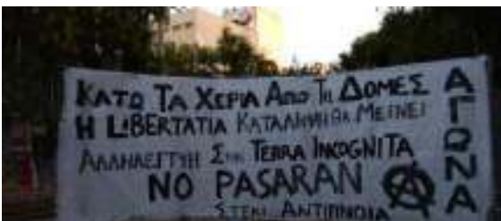
Πανό αλληλεγγύης στις καταλήψεις από το στέκι "Αντίπνοια" στα Πετράλωνα