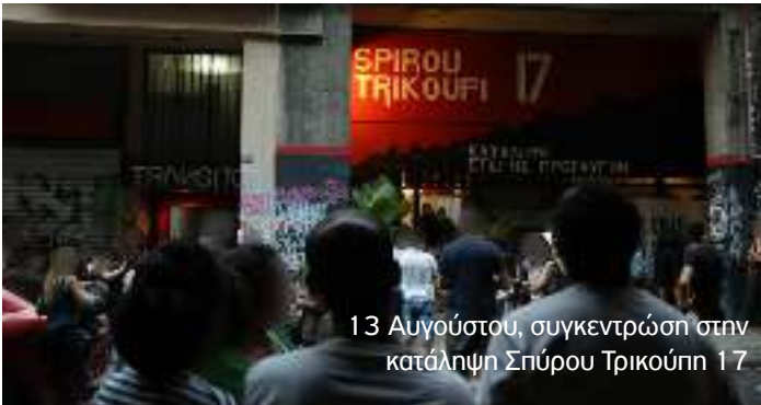
13 Αυγούστου, συγκεντρώση στην κατάληψη Σπύρου Τρικούπη 17