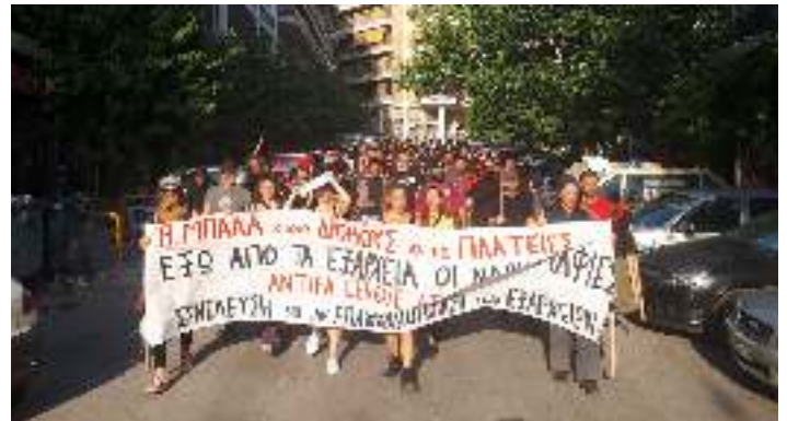
Η δεύτερη μέρα του 2ημέρου ενάντια στις ναρκομαφίες, τον κοινωνικό κανιβαλισμό και την κρατική καταστολή, με πορεία στους δρόμους των Εξαρχείων και αγώνες ποδοσφαίρου του antifa league

Σε αυτήν την κατεύθυνση στεκόμαστε αλληλέγγυοι σε κάθε αυτοοργανωμένη δομή και κάθε αγωνιστή που βρίσκεται αντιμέτωπος με την κρατική καταστολή και στηρίζουμε κάθε πρωτοβουλία που αναπτύσσεται με αγωνιστική αξιοπιστία και αξιοπρέπεια από τα κάτω απέναντι στην κρατική – καπιταλιστική βαρβαρότητα, πιστεύοντας πως όταν χτυπούν έναν από εμάς πρέπει να μας βρίσκουν όλους απέναντί τους. Συμμετέχουμε και στηρίζουμε τη συγκέντρωση και πορεία αλληλεγγύης στις καταλήψεις και τους αυτοοργανωμένους χώρους αγώνα στις 31 Αυγούστου στις 12:00 στην πλατεία Εξαρχείων, στην κατεύθυνση του χτισίματος ενός εξωστρεφούς πλατιού μετώπου αντίστασης στους σημερινούς κρατικούς σχεδιασμούς. Για την υπεράσπιση της ζωής, της αξιοπρέπειας, των αυτοοργανωμένων δομών, του ελεύθερου δημόσιου χώρου, της αγωνιστικής ιστορίας μας. Για τη διαμόρφωση των όρων της αυριανής κοινωνικής και ταξικής αντεπίθεσης.