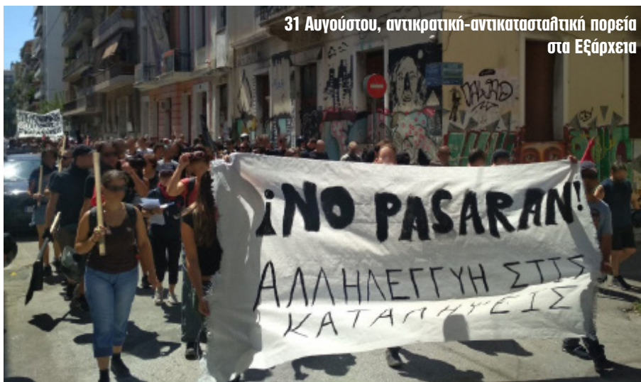
31 Αυγούστου, αντικρατική-αντικατασταλτική πορεία στα Εξάρχεια

Της επιχείρησης αυτής είχε προηγηθεί η ψήφιση αντεργατικών μέτρων, η κατάργηση του ασύλου, η ενίσχυση της ρατσιστικής νομοθεσίας απέναντι στους μετανάστες και τους πρόσφυγες, κατασταλτικές κινήσεις ενάντια σε κατειλημμένους χώρους στην Αθήνα και στα Γιάννενα. Μετά τις εκλογές, η νέα κυβέρνηση, πατώντας επάνω στα πεπραγμένα και της προηγούμενης διακυβέρνησης, ξεδίπλωσε την ατζέντα των επόμενων ετών και επι-