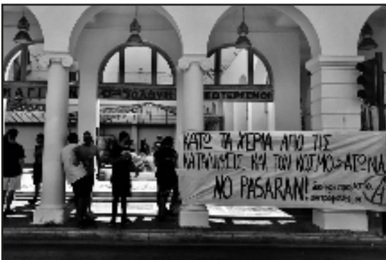
Συγκέντρωση - μικροφωνική στην Πάτρα