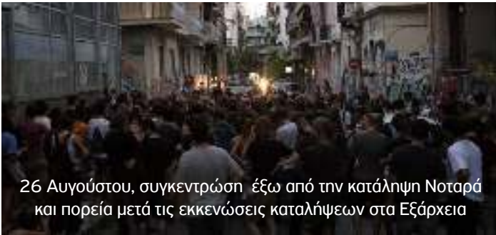
26 Αυγούστου, συγκεντρώση έξω από την κατάληψη Νοταρά και πορεία μετά τις εκκενώσεις καταλήψεων στα Εξάρχεια

Το Σάββατο 31 Αυγούστου έπειτα από κάλεσμα που απεύθυνε η συνέλευση «NO PASARAN» πραγματοποιήθηκε πορεία με τη μαζική συμμετοχή χιλίων και πλέον διαδηλωτών στους δρόμους των Εξαρχείων. Αψηφώντας την ιδεολογική τρομοκρατία και τον στρατό κατοχής των ΜΑΤ, οι αγωνιστές και οι αγωνίστριες μετέδωσαν ένα μήνυμα αντίστασης στην κρατική κατασταλτική εκστρατεία και αλληλεγγύης στους κατελιημένους χώρους αγώνα.