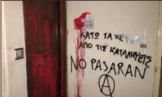
Επίθεση με μπογιές στο γραφείο του βουλευτή Αχαΐας της Νέας Δημοκρατίας Ανδρέα Κατσανιώτη, στην Πάτρα