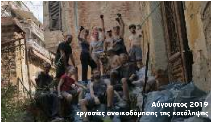
Αύγουστος 2019 εργασίες ανοικοδόμησης της κατάληψης