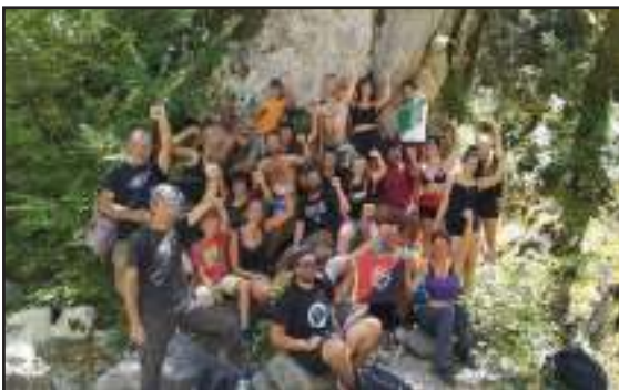
Για μια ακόμα φορά στη Μεσούντα Άρτας, στο σημείο όπου σκοτώθηκαν Βελουχιώτης και Τζαβέλλας. Μαζί με τους καλύτερους μας συντρόφους...