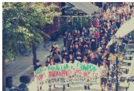
Από την πορεία που πραγματοποιήθηκε στην Καρδίτσα στις 22/8 έπειτα από τη ματαίωση της συνεδρίασης της οικονομικής επιτροπής