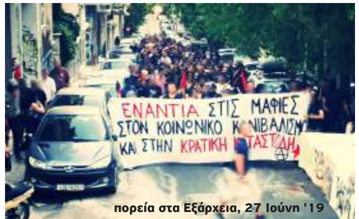
πορεία στα Εξάρχεια, 27 Ιούνη '19