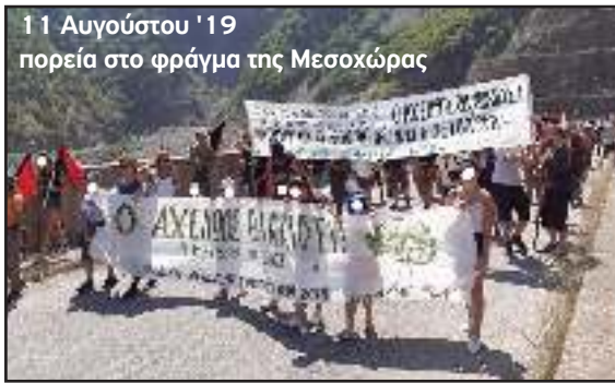
11 Αυγούστου '19 πορεία στο φράγμα της Μεσοχώρας