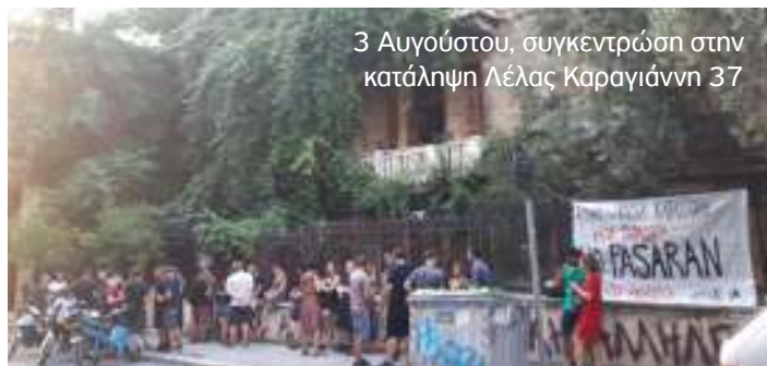
3 Αυγούστου, συγκεντρώση στην κατάληψη Λέλας Καραγιάννη 37

Στο πλαίσιο αυτής της αντιεξεγερτικής στρατηγικής εντάσσεται ο διακηρυγμένος στόχος για την κατοχή των Εξαρχείων – (μιας γειτονιάς που φέρει μια βαθιά κουλτούρα αμφισβήτησης της εξουσίας και ένα ιδιαίτερο ιστορικό και αγωνιστικό βάρος που της έχουν προσδώσει οι αγώνες χιλιάδων ανθρώπων. Από την περίοδο της Κατοχής, τα Δεκεμβριανά και τη Δικτατορία ως την εξέγερση του 2008, τις μεγάλες κινητοποιήσεις αντίστασης τα επόμενα χρόνια στην επιβολή επαχθέστερων όρων επιβίωσης, μέχρι και σήμερα. Και γι αυτόν τον λόγο αποτελεί ένα σημαντικό έδαφος στο κέντρο της πόλης για την ανάπτυξη ευρύτερα των κοινωνικών και ταξικών αντιστάσεων. Ένα αγκάθι στην επιχείρηση ολοκληρωτικής κρατικής επιβολής στην κοινωνία και ελέγχου της πόλης, προκαλώντας διαχρονικά το μένος των κρατικών αξιωματούχων και αμέτρητες ατελέσφορες κατασταλτικές επιχειρήσεις εδώ και δεκαετίες* Μιας γειτονιάς άρρηκτα συνδεδεμένης με το αναρχικό-αντιεξουσιαστικό κίνημα, και η οποία τα τελευταία χρόνια, με τις μαζικές αφίξεις κατατρεγμένων ανθρώπων από τις πολεμικές συρράξεις, έδωσε σπνοή στην αλληλεγγύη και την αλληλοβοήθεια, μέσα από πλήθος καταλήψεων στέγης. Μιας γειτονιάς, τέλος, που ο έλεγχος της από το κράτος επιχειρείται εδώ και χρόνια και μέσα από την εγκατάσταση ναρκομαφιών και την απόπειρα επικράτησης συνθηκών κοινωνικού κανιβαλισμού). Στην ίδια αντιεξεγερτική εκστρατεία εντάσσεται