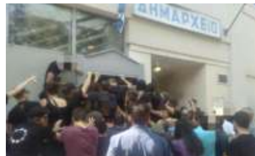
Από τη συγκέντρωση στις 5/8 στο Δημαρχείο Καρδίτσας