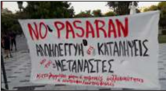
Συγκέντρωση - μικροφωνική στη Θεσσαλονίκη