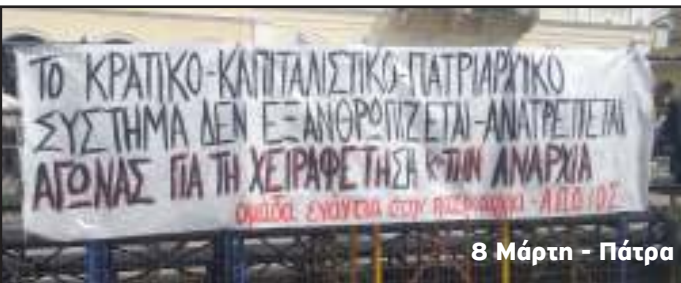
8 Μάρτη - Πάτρα