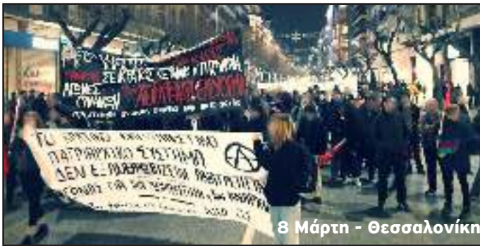
8 Μάρτη - Θεσσαλονίκη