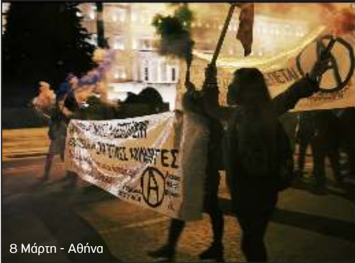
8 Μάρτην - Αθήνα

«Αυτή την 8η Μάρτη, στο τέλος των παρουσιάσεών μας, καθεμιά από μας άναψε μια μικρή φλόγα. [...] Αυτή η μικρή φλόγα είναι για σένα. Κράτησέ την αδελφή και συντρόφισσα. Όταν νιώθεις μόνη. Όταν φοβάσαι. Όταν νιώθεις ότι ο αγώνας είναι πολύ δύσκολος ή ότι δύσκολη είναι η ζωή η ίδια. Άναψέ τη ξανά στην καρδιά σου, στη σκέψη σου, μέσα σου. Και μην την κρατήσεις μόνο για σένα, συντρόφισσα και αδελφή. Πήγαινε τη στις εξαφανισμένες. Πήγαινε τη στις δολοφονημένες. Πήγαινε τη στις κρατούμενες. Πήγαινε τη στις γυναίκες που βιάστηκαν. Πήγαινε τη στις γυναίκες που χτυπήθηκαν. Πήγαινε τη στις γυναίκες που κακοποιήθηκαν. Πήγαινε τη σε όσες έχουν υποστεί βία κάθε μορφής. Πήγαινε τη στις μετανάστριες. Πήγαινε τη στις εκμεταλλευόμενες. Πήγαινε τη στις νεκρές. Πήγαινε τη και πες σε κάθε μία ξεχωριστά ότι δεν είναι μόνη, ότι θα αγωνιστείς εσύ γι' αυτήν ότι θα αγωνιστείς για την αλήθεια και τη δικαιοσύνη που αξίζει ο πόνος της, ότι θα αγωνιστείς ώστε αυτός ο πόνος που κουβαλά να μην επαναληφθεί ξανά για καμιά γυναίκα στον κόσμο. Πάρε αυτή τη φλόγα και μεταμόρφωσέ τη σε οργή, σε κουράγιο, σε αποφασιστικότητα. Πάρ' τη και ένωσέ τη με άλλες φλόγες. Κράτα τη και τότε ίσως σκεφτείς ότι δεν μπορεί να υπάρξει ούτε αλήθεια ούτε δικαιοσύνη ούτε ελευθερία μέσα στο πατριαρχικό καπιταλιστικό σύστημα. Και τότε ίσως ξανασυναντηθούμε για να βάλουμε φωτιά στο σύστημα. Και ίσως βρίσκεσαι δίπλα μας, για να βεβαιωθούμε ότι κανείς δεν θα σβήσει τη φωτιά μέχρι να μη μείνει τίποτα άλλο εκτός από στάχτες.»