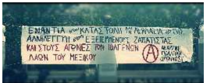
Από την συγκέντρωση που πραγματοποιήθηκε στην πρεσβεία του Μεξικού το Σάββατο 9 Μάρτη