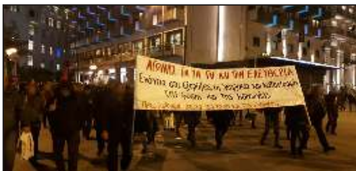
Από την πορεία ενάντια στις εξορύξεις που πραγματοποιήθηκε την Πέμπτη 21 Φλεβάρη στην Αθήνα.

Έτσι, πέραν των εγκληματικών μεγάλων έργων που επιχειρούνται σήμερα, όπως τα Υ/Η φράγματα στον Αχελώο και τα ανοιχτά μεταλλεία χρυσού στη Χαλκιδική, αναγγέλλονται ήδη και επιχειρούνται μια σειρά και άλλων καταστροφικών για τη φύση και τις τοπικές κοινωνίες σχεδιασμών σε πλήθος σημείων της χώρας. Όπως είναι η εγκατάσταση αιολικών βιομηχανικών ζωνών σε όλα τα ορεινά συγκροτήματα, το γιγαντιαίο πρόγραμμα “ΗΛΙΟΣ” φωτοβολταϊκών βιομηχανικών ζωνών, η κατασκευή εκατοντάδων Υ/Η φραγμάτων σε πλήθος ποταμών και χειμάρρων, η παράδοση αναρίθμητων φυσικών οικοτόπων στην τουριστική βιομηχανία, η εξορύξεις υδρογονανθράκων σε θαλάσσιες και χερσαίες εκτάσεις σε όλο το έδαφος της ελληνικής επικράτειας κ.α. Αντικοινωνικοί και καταστροφικοί για τη φύση σχεδιασμοί, που θα αποτελέσουν την αιχμή της κρατικής και καπιταλιστικής προπαγάνδας