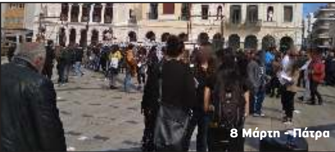
8 Μάρτη - Πάτρα