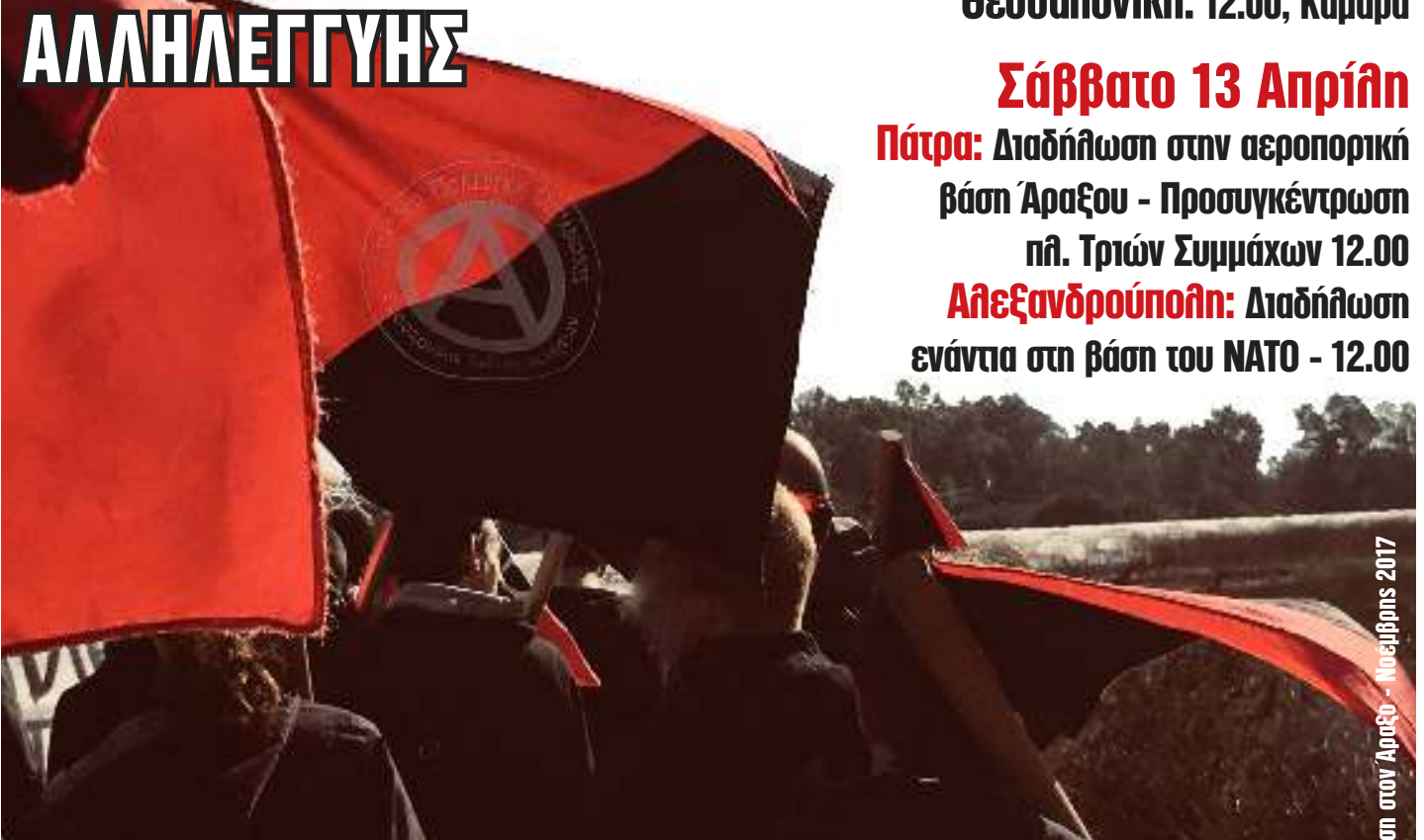
Διαδήλωση στον Άραξο - Νοεμβρίου 2017

ΕΝΑΝΤΙΑ ΣΤΗΝ ΚΡΑΤΙΚΗ ΚΑΙ ΚΑΠΙΤΑΛΙΣΤΙΚΗ ΒΑΡΒΑΡΟΤΗΤΑ ΤΟΝ ΠΟΛΕΜΟ ΚΑΙ ΤΟΝ ΣΥΓΧΡΟΝΟ ΟΛΟΚΛΗΡΩΤΙΣΜΟ