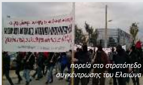
πορεία στο στρατόπεδο συγκέντρωσης του Ελαιώνα

Αναρχικές Συλλογικότητες Όμικρον72 & Κύκλος της Φωτιάς μέλη της ΑΠΟ