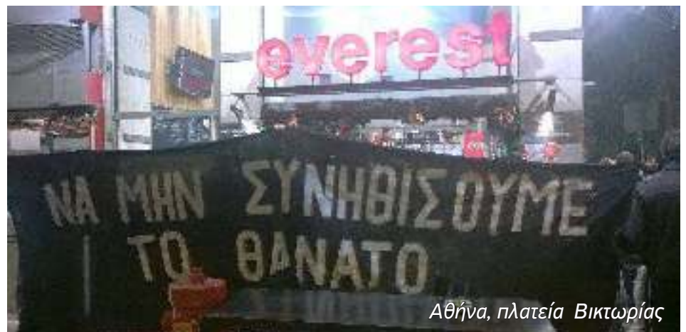
Αθήνα, πλατεία Βικτωρίας

αναρχική ομάδα "Δυσήνιος Ίππος"/μέλος της Αναρχικής Πολιτικής Οργάνωσης - Ομοσπονδία Συλλογικότητων