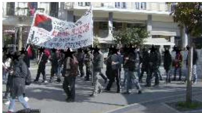
Πάτρα, 8 Δεκέμβρη '16