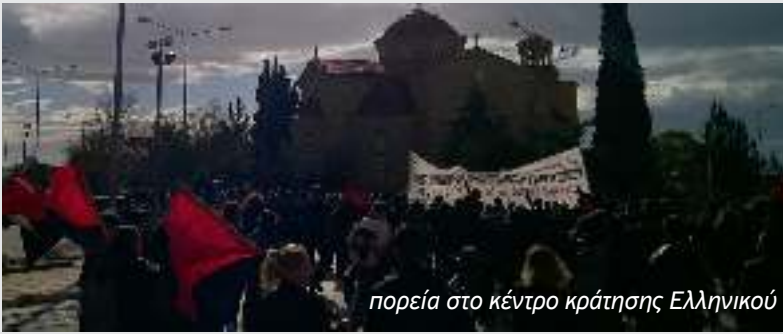
πορεία στο κέντρο κράτησης Ελληνικού

Τα τελευταία τρία χρόνια στις εγκαταστάσεις του παλιού αεροδρομίου του Ελληνικού βρίσκονται φυλακισμένες μετανάστριες και παιδιά. Η έλλειψη ιατροφαρμακευτικής περίθαλψης, οι περιορισμένες ποσότητες φαγητού και η απάνθρωπη μεταχείριση από τους ανθρωποφύλακες είναι μόνο κάποια από αυτά που βιώνουν οι έγκλειστες εντός του στρατοπέδου συγκέντρωσης. Ανέναντι στις ασφυκτικές συνθήκες διαβίωσης που επιβάλλουν το κράτος και το κεφάλαιο ολόένα και περισσότερες μετανάστριες προχωρούν σε κινήσεις αγώνα και αντίστασης. Από την αποχή συσσιτίου και την απεργία πείνας μέχρι την άρνηση εισόδου στα κελιά και τον νικηφόρο αγώνα της Sanaa Taleb, ενάντια στην βίαιη απέλαση της, αποδεικνύεται πως από τους από τα πάνω τίποτα δεν δίνεται αυτονόητα και ότι για να έχουν ακόμα και τα στοιχειώδη πρέπει να τα διεκδικήσουν.