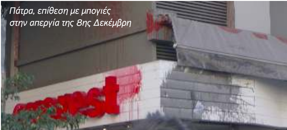
Πάτρα, επίθεση με μπογιές στην απεργία της 8ης Δεκέμβρη

Την Πέμπτη 1/12/16 λίγο μετά τις 9 το πρωί σημειώθηκε έκρηξη στο κατάστημα EVEREST που βρίσκεται στην πλατεία Βικτωρίας στην Αθήνα. Αποτέλεσμα αυτής της έκρηξης ήταν ο θάνατος της λογίστριας της επιχείρησης και ο τραυματισμός ακόμα 3 εργαζομένων και 2 περαστικών. Η εργαζόμενη εγκλωβίστηκε στο γραφείο που δούλευε, το οποίο βρισκόταν στο υπόγειο του καταστήματος, ενώ παράλληλα δίπλα στη κουζίνα γίνονταν εργασίες συντήρησης χωρίς προφανώς η εταιρία να φροντίσει να πάρει τα απαραίτητα μέτρα ασφαλείας. Το περιστατικό αυτό, δεν είναι εξαίρεση στον κανόνα, αλλά αποτελεί καθημερινή συνθήκη στους χώρους δουλειάς και εντάσσεται στο μακρύ κατάλογο των «εργατικών ατυχημάτων» που έχουν αποτέλεσμα είτε το βαρύ τραυματισμό, είτε το θάνατο των εργαζομένων, μιας και η ασφάλεια των εργαζομένων κοστίζει ακριβά στους εργοδότες.