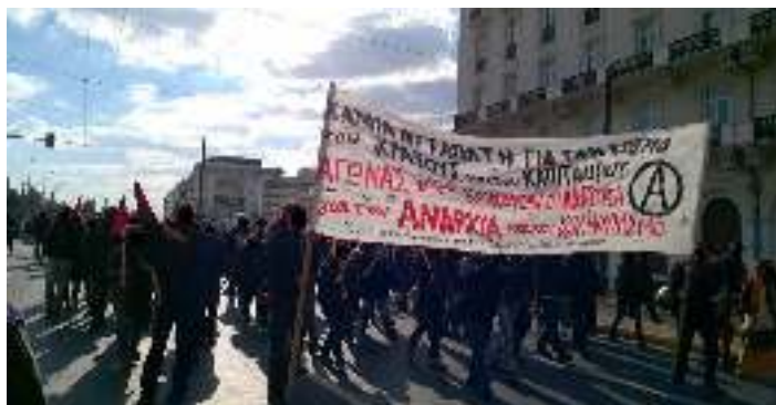
Αθήνα, 8 Δεκέμβρη '16