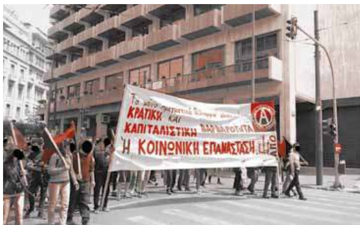
Το πανό του τοπικού συντονισμού Αθήνας, Σύνταγμα 8/5/2016

Την Κυριακή 8/5 ο τοπικός συντονισμός της Αθήνας πραγματοποίησε τη συγκέντρωση για μια Αναρχική Πρωτομαγιά στα Προπύλαια στις 11 το πρωί. Μετά από μιάμιση ώρα και αφού η ΓΣΕΕ και το ΠΑΜΕ είχαν τελειώσει τις συγκεντρώσεις τους, το πανό του τοπικού συντονισμού κινήθηκε από τη Σταδίου προς το Σύνταγμα. Τελιώνοντας την πορεία το πανό στάθηκε στη συμβολή των δρόμων Φιλελλήνων και Ερμού προκειμένου να στηριχθεί η απεργιακή συγκέντρωση και οι αποκλεισμοί που πραγματοποιούσε το Συντονιστικό ενάντια στην κατάργηση της Κυριακάτικης Αργίας και τα απελευθερωμένα ωράρια. Το απόγευμα της ίδιας μέρας και την ώρα ψήφισης του πολυνομο-