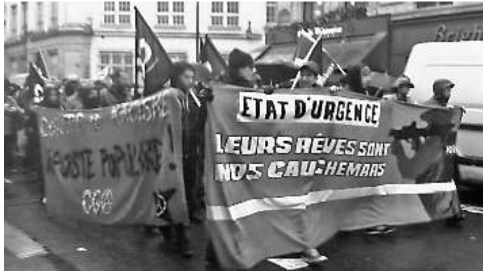
Στις 30 Ιανουαρίου και στις 6 Φεβρουαρίου πραγματοποιήθηκαν σε δεκάδες μεγάλες πόλεις της Γαλλίας διαδηλώσεις ενάντια στο καθεστώς έκτακτης ανάγκης. Στο Παρίσι, στις 30/1, σχηματίστηκε αναρχικό μπλοκ με πρωτοβουλία της ομάδας Regard Noir της αναρχικής ομοσπονδίας (FA).

τρείας ή καταστημάτων «μουσουλμάνων» από ακροδεξιούς, δείχνουν ότι (οι τελευταίοι) έχουν σωστά κατανοήσει το μήνυμα από την πλευρά του κράτους. Κάνουν την ίδια δουλειά, την υποκρισία και τη νομιμότητα.